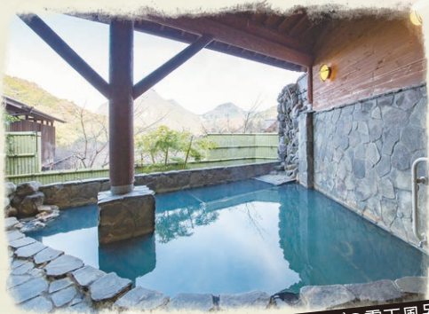
自然とひとつになれるやすらぎの露天風呂

自然のやさしさと温かさに浸る郷 木々の語らいが聞こえる大自然の中、 旬の食材を採れたてで調理、 温泉も楽しめます。