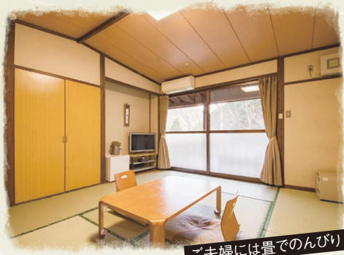
ご夫婦には畳でのんびり

自然のやさしさと温かさに浸る郷 木々の語らいが聞こえる大自然の中、 旬の食材を採れたてで調理、 温泉も楽しめます。