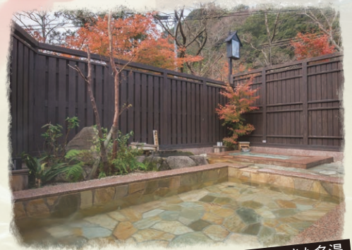
湯治場として愛されてきた名湯

湯治客に人気の赤根温泉郷 グループでのご利用に最適です!! 地元の方々にも親しまれ、料理も温泉も 楽しんでいただける、ふれあいの里渓泉。