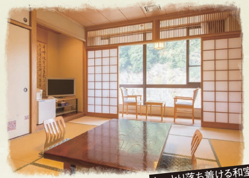
しっとり落ち着ける和室

湯治客に人気の赤根温泉郷 グループでのご利用に最適です!! 地元の方々にも親しまれ、料理も温泉も 楽しんでいただける、ふれあいの里渓泉。